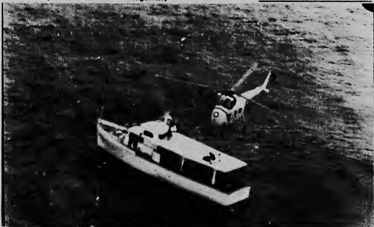
PANAMA - Un helicoptero di forza aerea norteamericano di Howard Air Base ta bulando riba un boto riba laman durante un busqueda den Caribe pa posible sobrevivientenan di un avio n C-54 di Argentina qu a desaparece algun dia pasá. Nan a hafia dierente salbabida qu a ser identifica como esunnan qu tabatin a bordo di e avion C-54.